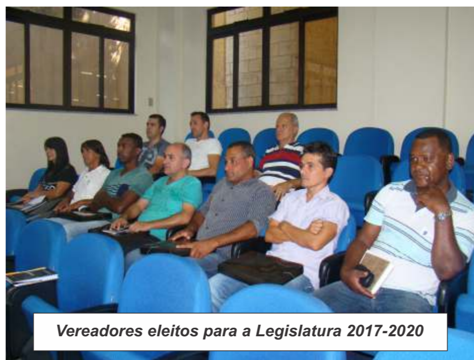
Vereadores eleitos para a Legislatura 2017-2020

Na oportunidade, os novos vereadores receberam uma apostila com o conteúdo do 1º ciclo de treinamentos, bem como a Lei Orgânica do Município e o Regimento Interno da Câmara, devidamente atualizados.